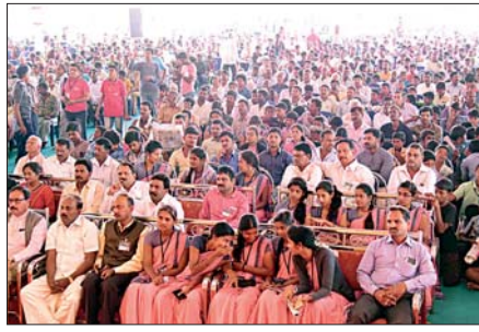
ಸುತ್ತೂರು ಜಾತ್ರೆ ಮಹೋತ್ಸವದ ಅಧ್ಯಕ್ಷತಾ ಸಮಾರಂಭದಲ್ಲಿ ವಿವಿಧ ಪ್ರದೇಶಗಳಿಂದ ಆಗಮಿಸಿದ್ದ ಜನ ಸಮೂಹವನ್ನು ಕಾಣಬಹುದು.